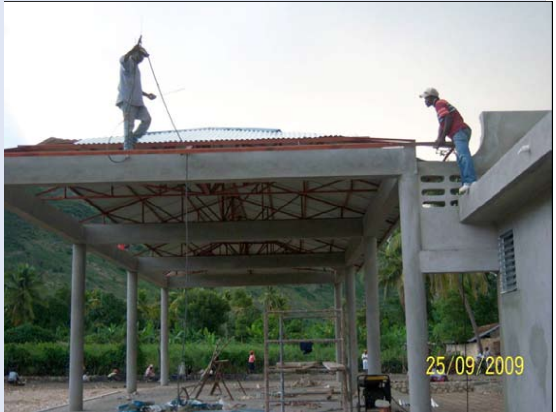
Rivetage des tôles ondulées

Le Projet de transport et de développement territorial (PTDT) vise essentiellement à créer les conditions d'un développement économique accéléré dans